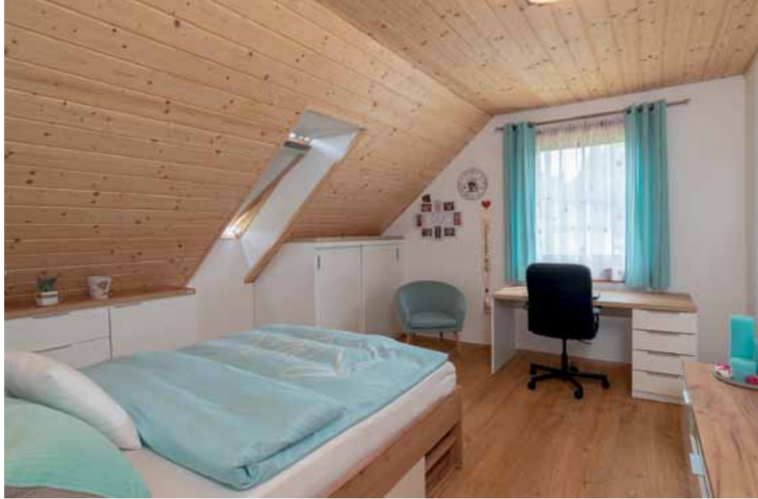
Každé ze tří již dospělých dětí má v patře svůj vlastní pokoj

Starba celou rodinu posílila, stmelila. Každý přiložil ruku k dílu, každý z rodiny na roubence zanechal svou „stopu“.