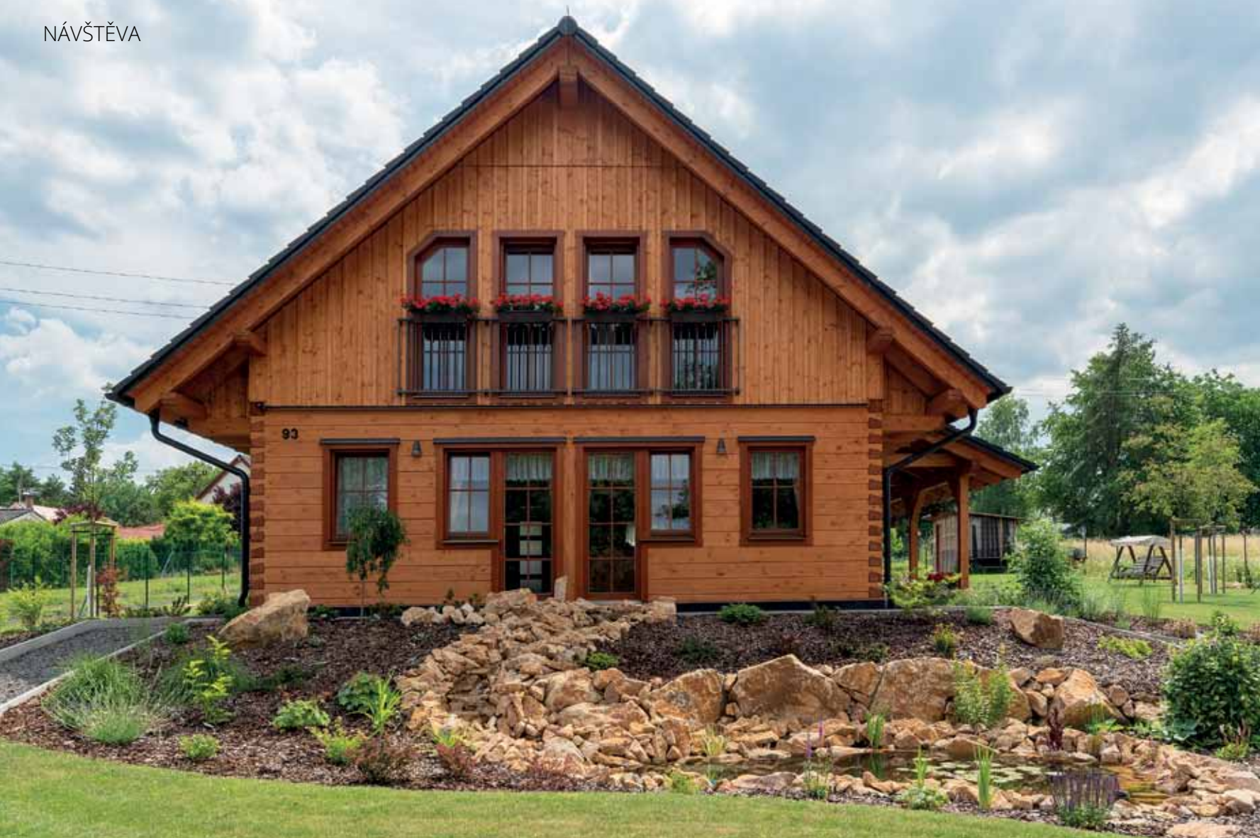
Původně mělo být ve štítové stěně francouzské okno, nakonec museli majitelé zvolit toto řešení