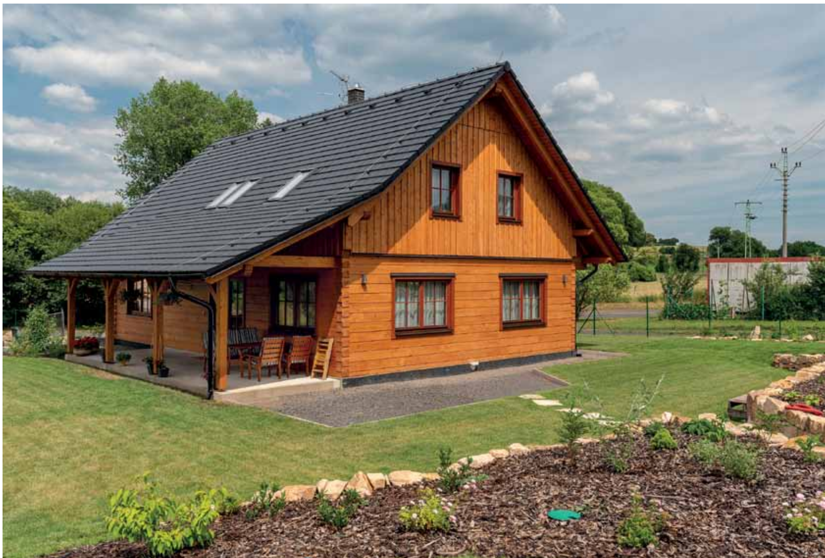
Terasa domu je natočena na západ, slunce na ni svítí tedy až v pozdním odpolední, kdy už nemá takovou sílu, takže je tam chladněji

hodli jsme se pro posuvné dveře, ale ty se do roubené stěny umísťují obtížně, příčka mezi obývacím pokojem a kuchyní musela být proto zděná, aby se do ní dalo instalovat dveřní pouzdro. Dům projektoval nezávislý projektant, v těchto i dalších našich požadavcích jsme s ním jen obtížně hledali společnou řeč, projekt proto upravila realizační firma. V tomto případě byl problém i v tom, že stavební dokumentace nebyla zcela v pořádku z hlediska statiky a muselo dojít ke změně dispozic a štítové stěny domu. Vše bylo o to složitější, že jsme již měli zhotovenou základovou desku podle původní dokumentace.“