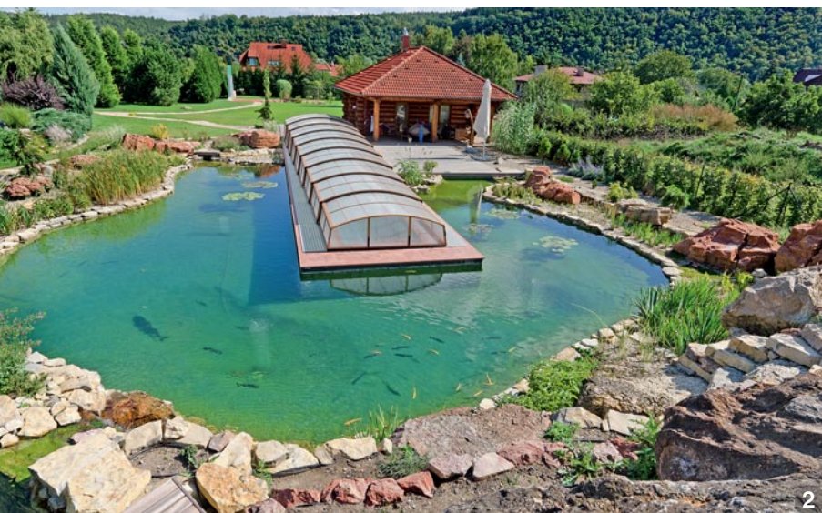
1 – 3 STŘEDOBODEM ZAHRADY JE VELKÉ PŘÍRODNÍ JEZÍRKO SE ZASTŘEŠENÝM BAZÉNEM INTEGROVANÝM DO VODNÍ PLOCHY A OKOLÍM, KTERÉMU DOMINUJE KÁMEN V MNOHA PODOBÁCH

Zdejší dostavby a přístavby ukazují výhody a možnosti srubových staveb. Fakt, že dokážou reagovat na běh života, růst rodiny i na to, jaké má člověk zájmy: vždyť první stavbu jsme vyrobili pro jednoho člověka, poslední už pro velkou rodinu.