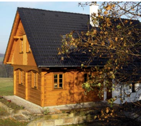
Roubenka krok za krokem